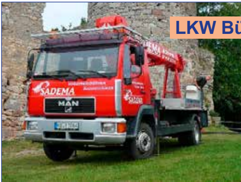
LKW Bühne 30m