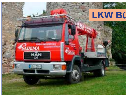
LKW Bühne 30m